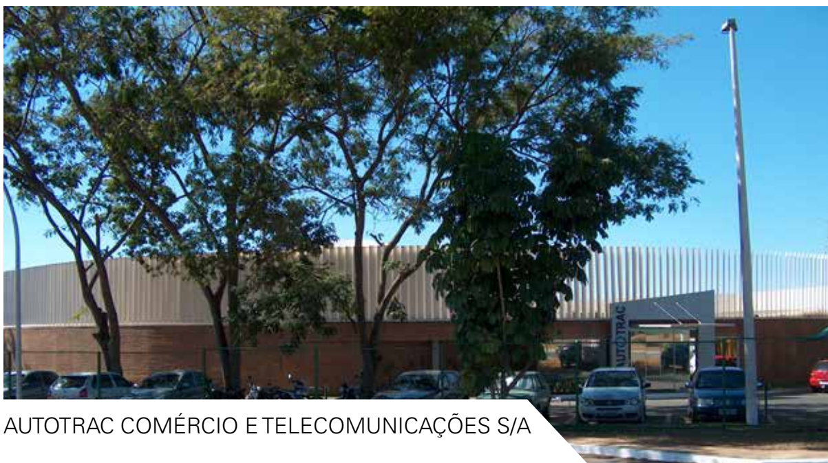
AUTOTRAC COMÉRCIO E TELECOMUNICAÇÕES S/A