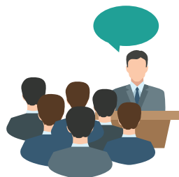
CASES DE IMPACTO (mercado)

As apresentações de cases na Feira de Negócios e Inovação serão divididas em duas categorias. Sendo elas: